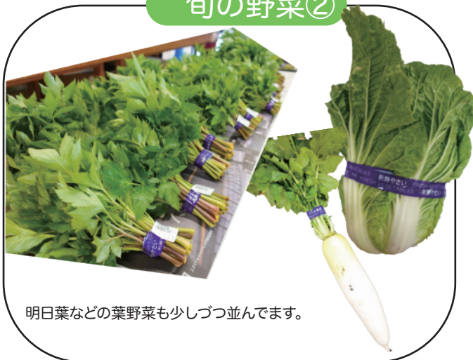
明日葉などの葉野菜も少しづつ並んでます。