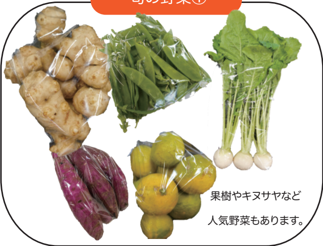
果樹やキヌサヤなど 人気野菜もあります。